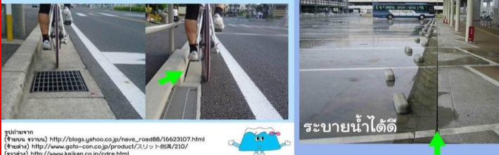
ระบายน้ำได้ดี

รับมาจาก (ข้อมูล ข่าวสาร) http://blogs.jphoo.co.jp/news_read88/16623107.html (โฆษณา) http://www.goto-con.co.jp/product/2.0.1-08A/210/ (รางวัล) http://www.keiken.co.jp/ctre.html